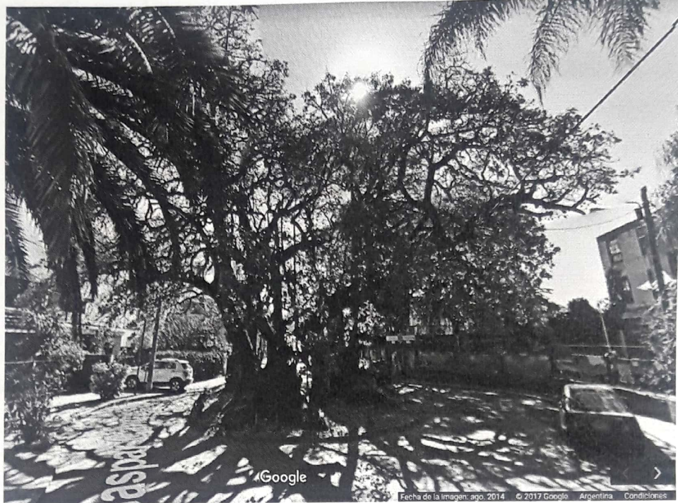
Imagen del Ombú luego de su mutilación